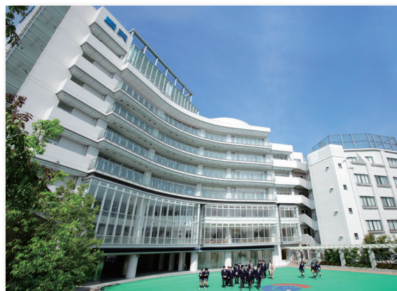
順天中学校・高校